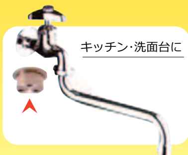
キッチン・洗面台に

どんな給水設備にも対応可能です。一般的な蛇口にはもちろんトイレのロータンクや工場などのインチ企画にも対応します。特殊加工やオーダーメイドも可能です。