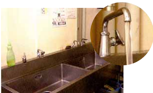
大手スーパーにて